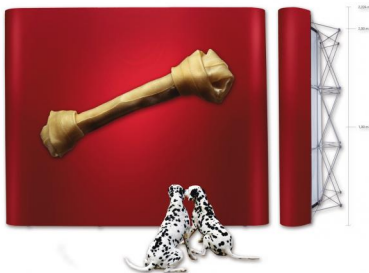
Pop-Up Magnetic, gerade: