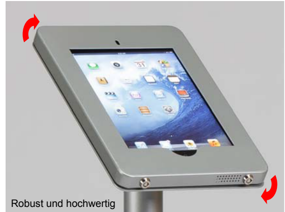
Robust und hochwertig